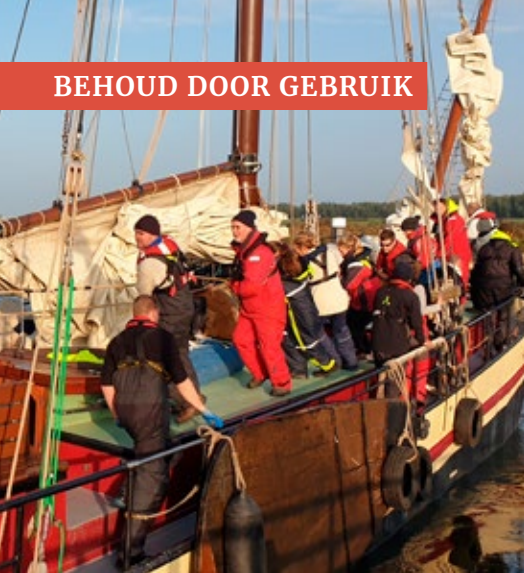
Een carousel aan mensen trekt de Gulden Belofte van lagerwal af