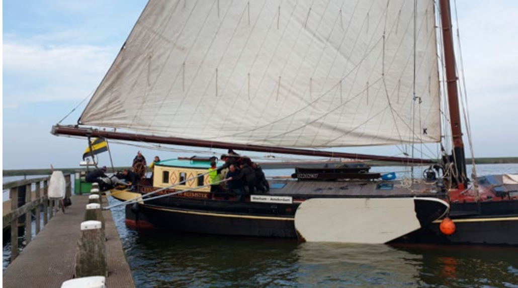
De bomers op de Hendrika hebben een flinke klus aan het door de wind bomen van het schip