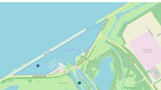
De Blocq van Kuffeler