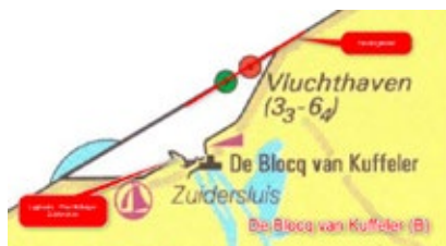
Het vaarkaartje voor de schippers

de steiger, het is pal lagerwal. Het schip ligt met de voorkant richting de sluis en wordt naar achteren verhaald om rond het einde van de steiger in de wind te kunnen draaien. Het grootzeil gaat weer omhoog en als de looper terug is, gaan de trossen los en wordt de kop van het schip van de wal afgeduwd. Niet meer betuigd door de spring heeft het schip andere plannen en gaat alvast vooruit, waarbij de giek richting het aanwijzingsbord met lamp gaat, dat aan het eind van de steiger staat. Net op tijd gaat de kraanlijn erin om schade te voorkomen en duwt een bemanningslid de smeerrepen die onder de giek hangen over het armatuur heen. Doordat het schip nu geheel langs de steiger ligt, ondertussen met achtertros, wordt het een flinke klus voor de bomers om de kop door de wind te bomen. Na flink ploeteren lukt het en begint de Hendrika aan het kruisen richting de haveningang, waar even daarvoor klipper Vriendentrouw naar binnen is gedraaid.