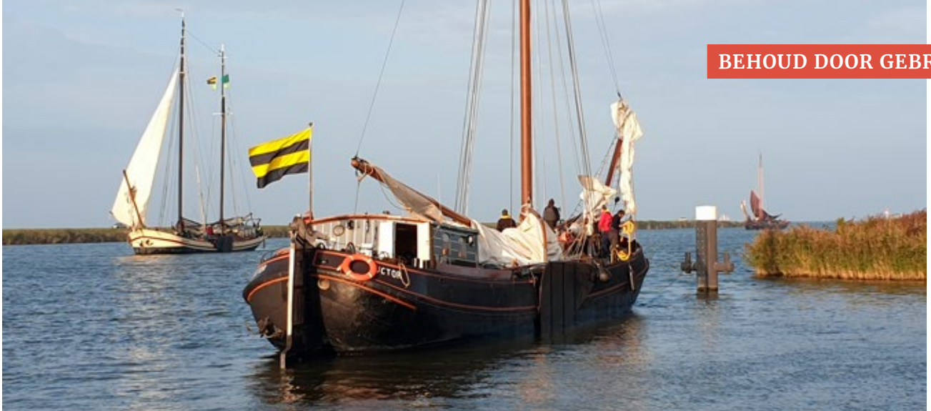
Terwijl de Luctor de afvaart voorbereidt, komen de Gulden Belofte en de Willem Jacob richting de landingsplek zeilen

steiger is er ruimte om zeil te zetten en voor de havendam overstag te gaan.