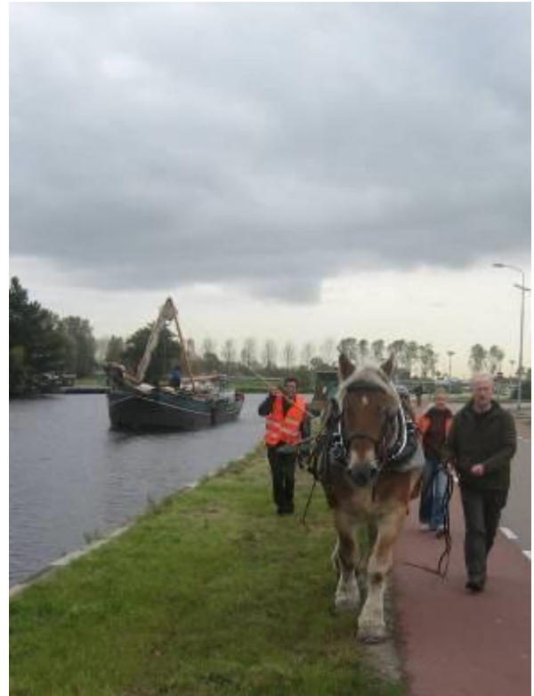
De Karin, voortgetrokken door paard