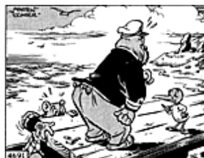
1 e prijs de Lutgederdina: